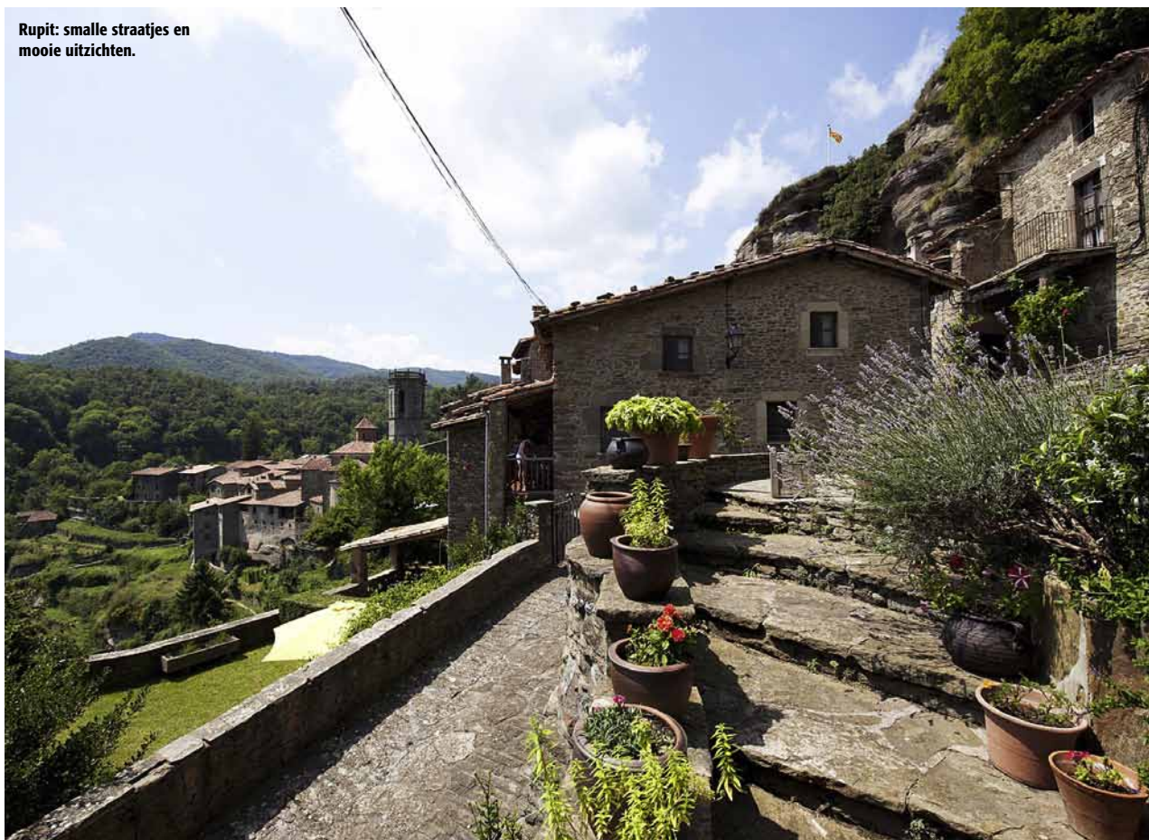
Rupit: smalle straatjes en mooie uitzichten.