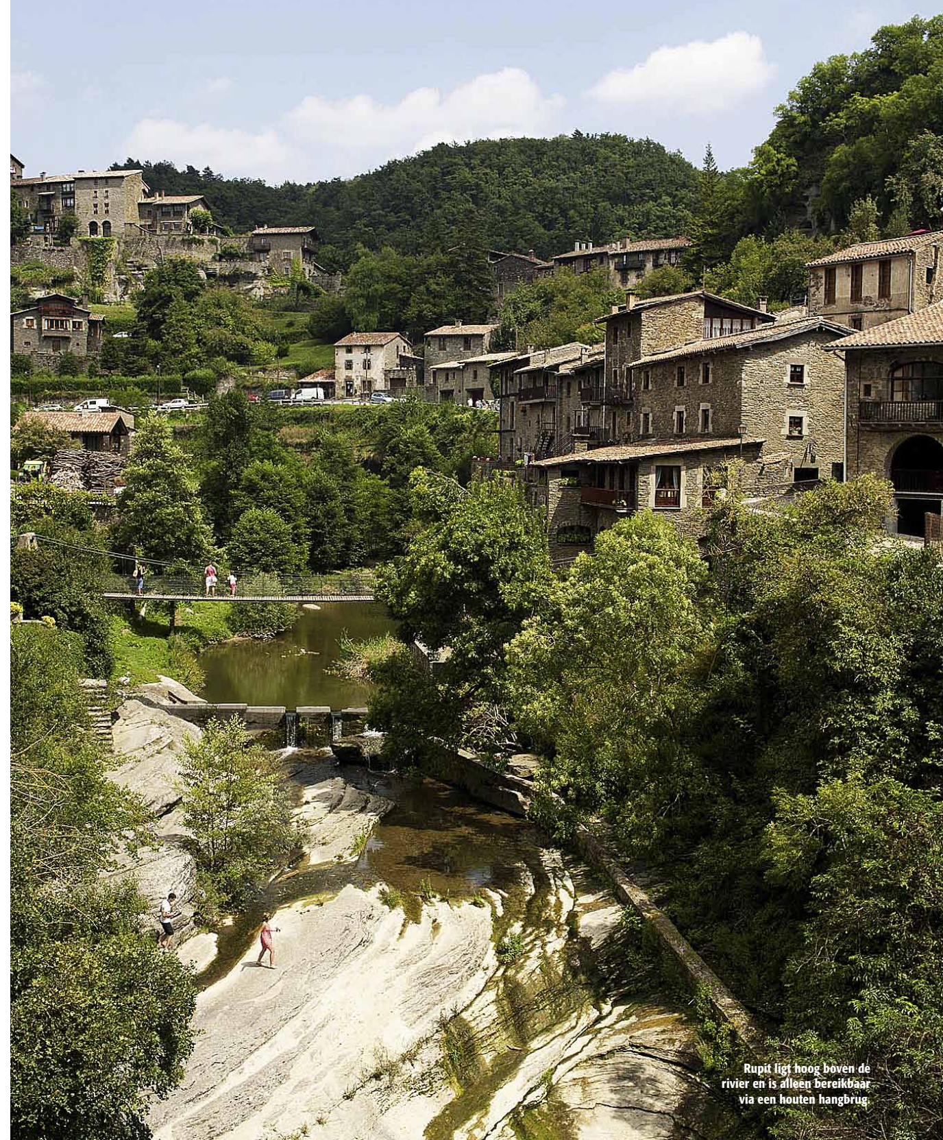
Rupit ligt hoog boven de rivier en is alleen bereikbaar via een houten hangbrug.

De hele dag samen bezig zijn, dat is voor ons vakantie. 's Ochttends lekker actief de omgeving verkennen en 's middags afkoelen in het zwembad.