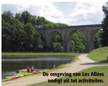
De omgeving van Les Allées nodigt uit tot activiteiten.