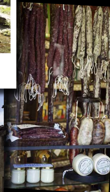
Winkeltjes met typische Catalaanse streekproducten.

Even bijkomen van alle indrukken. We ploffen neer op een terrasje voor een verkoelend drankje de kinderen krijgen een lekker ijsje.