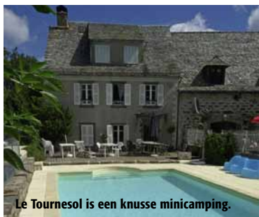
Le Tournesol is een knusse minicamping.