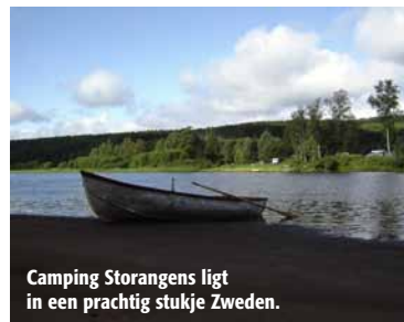
Camping Storängens ligt in een prachtig stukje Zweden.