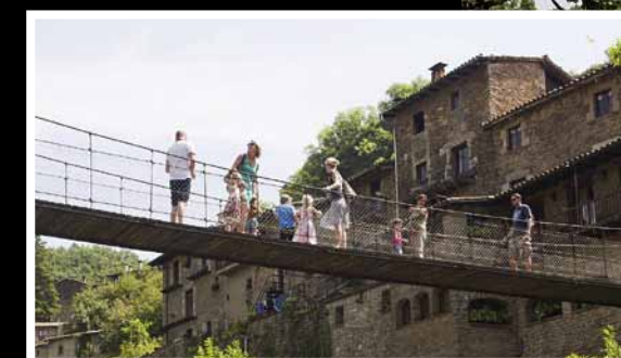
Via de houten wiebelige hangbrug bereiken we het middeleeuwse Rupit.