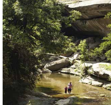
We lopen de avontuurlijke route naar Rupit: langs en door de rivier.